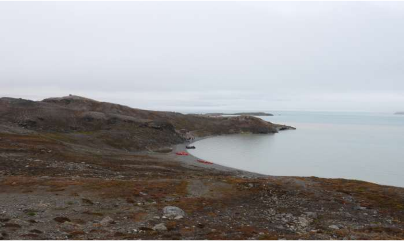
เขตอนุรักษณ์ธรรมชาติซอร์ราสต์ (Soraust Svalbard Nature Reserve)

เป็นเกาะขนาดเล็กทางตอนเหนือของสวาลบาร์ด มีพื้นที่เนินเขาเตี้ยๆและอยู่ใกล้กับธารน้ำแข็งทางตอนเหนือของสวาลบาร์ดอีกด้วย ที่นี่ได้รับการขนานนามว่า อ่าวแห่งรัก (Love Bay) ท่านจะได้ชื่นชมทัศนียภาพและความสวยงามของอ่าว รวมถึงสัตว์ไม่ว่าจะเป็นหมีขาว แมวน้ำ ที่มีถิ่นอาศัยในบริเวณนี้เช่นกัน